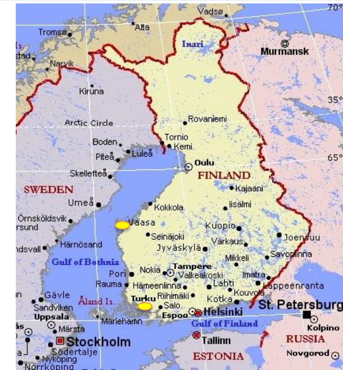
Turku Finland Map - Bing images