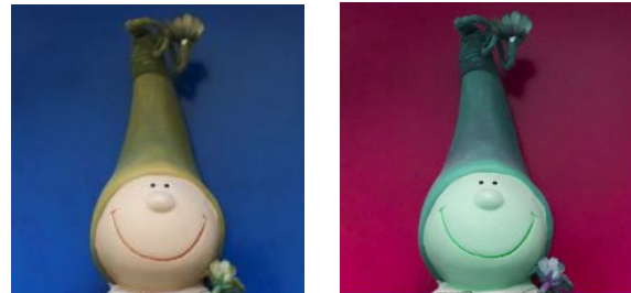
Abbildung 1: Umwandlung eines Farbbildes in ein Falschfarbenbild

Aufgabe 1: Informieren Sie sich im Internet über die Anwendungsgebiete von Falschfarbenbildern und Farbcodierungen. Erstellen Sie eine Liste.