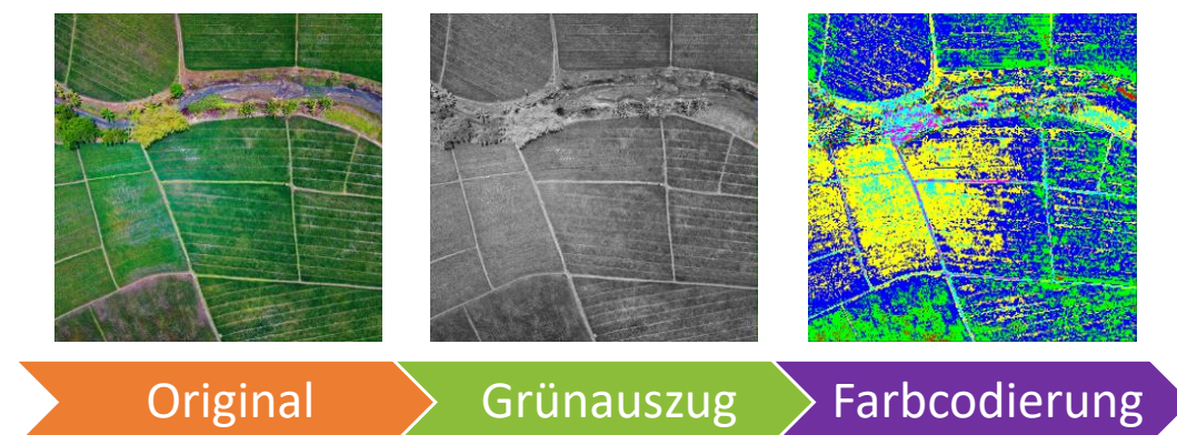
Abbildung 3: Vom Original zur farbcodierten Darstellung einer Luftbildaufnahme.

Ein Landschaftsbild von Feldern und Grünflächen enthält viele Schattierungen im Bereich Grün. Der Grünauszug eines Landschaftsbildes kann verwendet werden, um den verschiedenen Grüntönen unterschiedliche Farben zuzuordnen und die Unterschiede damit deutlich sichtbar zu machen. Abbildung 3 zeigt ein Beispiel.