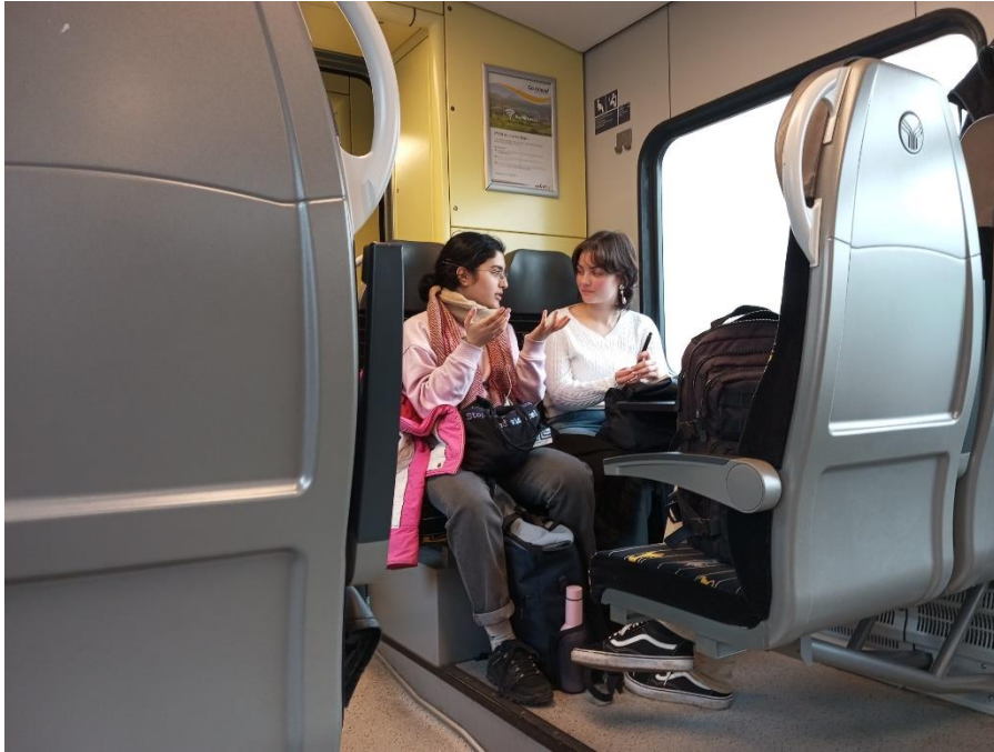
Auf der Fahrt