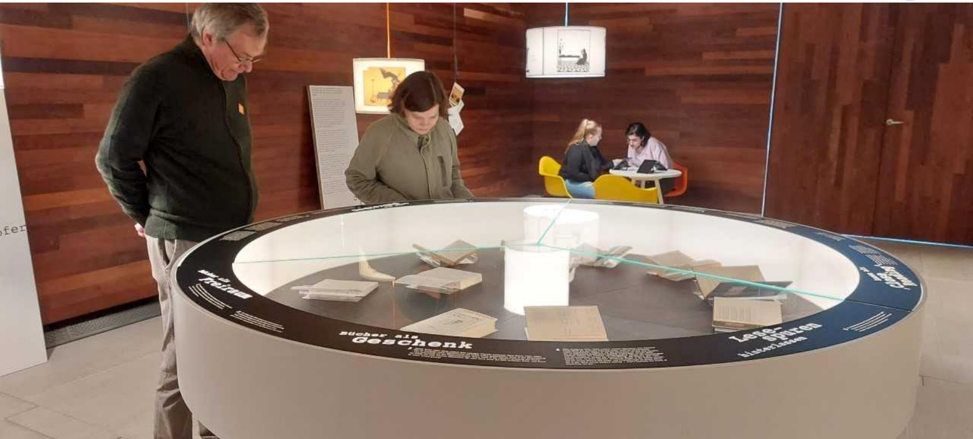
Im Literaturmuseum der Moderne, kurz LiMo