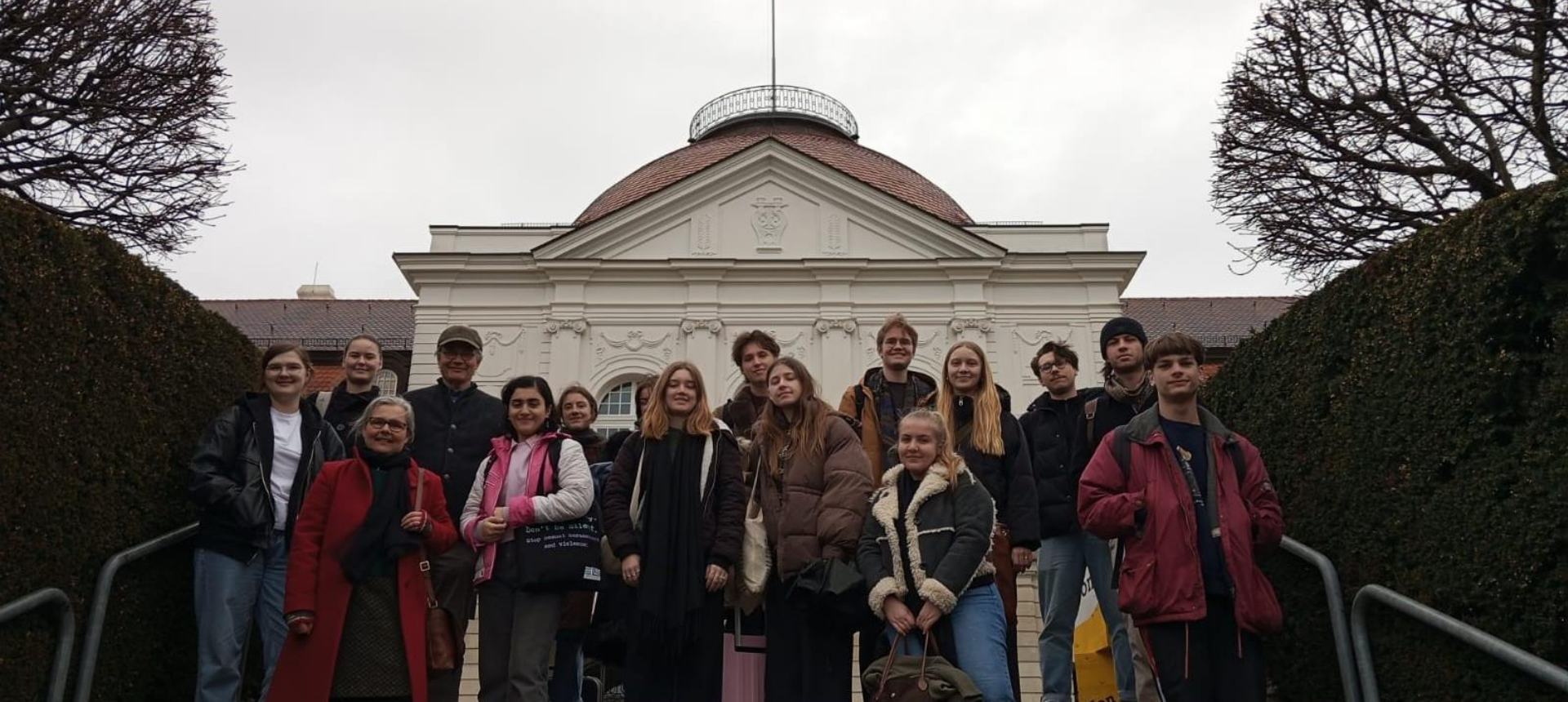
Vor dem Schiller-Nationalmuseum