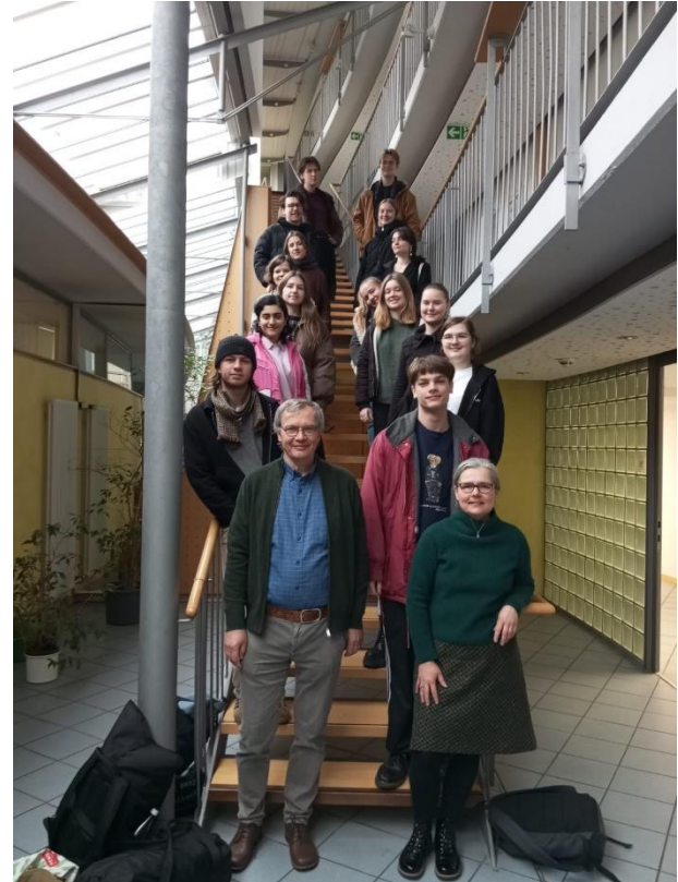
Unterkunft im Collegienhaus